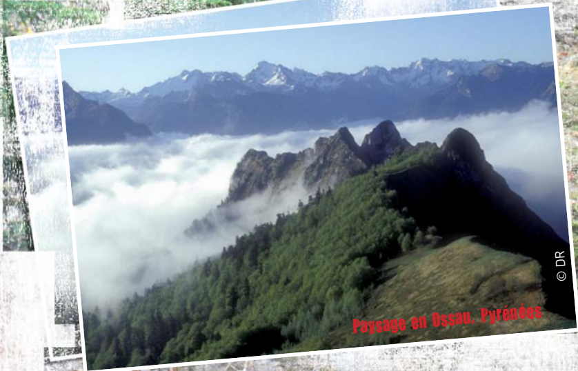
Paysage en Ossau, Pyrénées