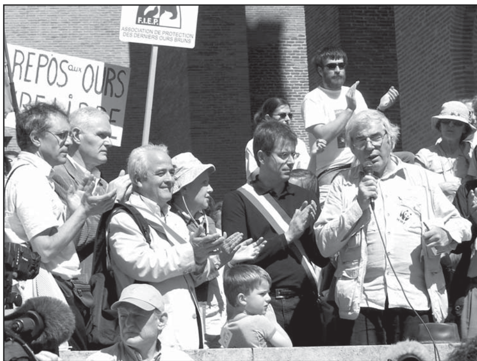
Manifestation pour l'ours à Toulouse en juin 2006, notamment aux côtés des maires d'Arbas et de Luchon